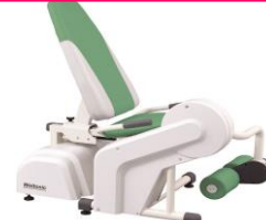
階段昇降の安定性