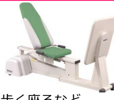
立つ歩く座るなど 足全体の筋力向上