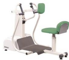
肩可動範囲の柔軟性