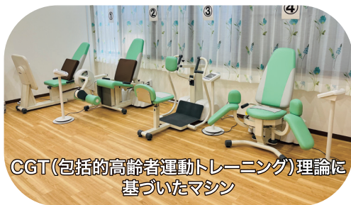
CGT(包括的高齢者運動トレーニング)理論に基づいたマシン