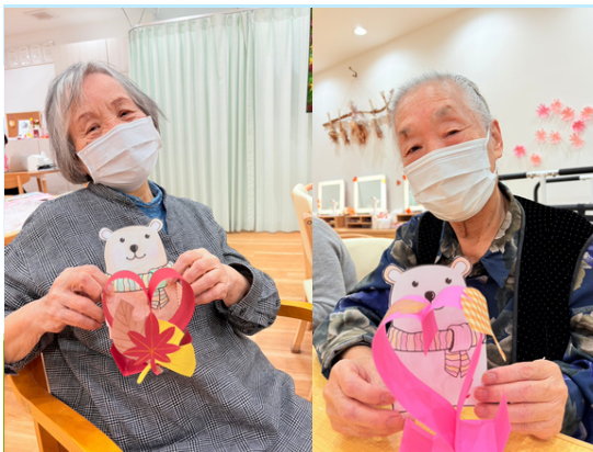
紅葉を感じる「クマの置物」を作りました