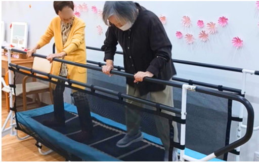
トランポリン型平行棒で運動する様子