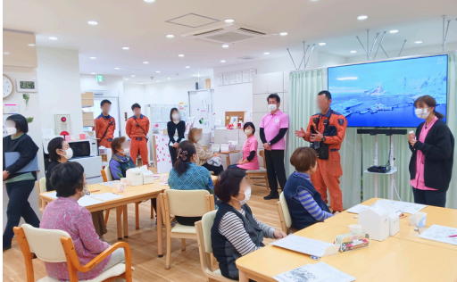
消防訓練に参加した様子