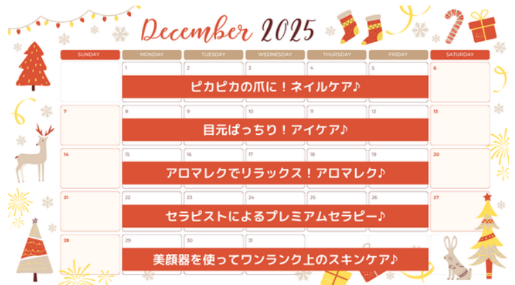
12月の美容レクのスケジュール