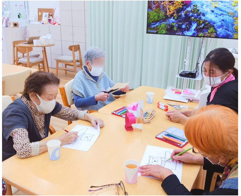
創作レクで「クマの置物」を作る様子