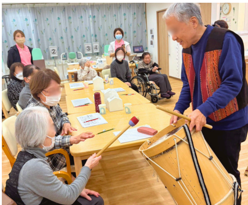
南米音楽の楽器を楽しむ様子