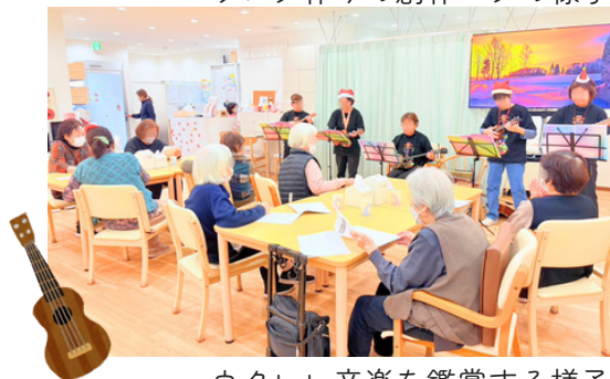
ウクレレ音楽を鑑賞する様子