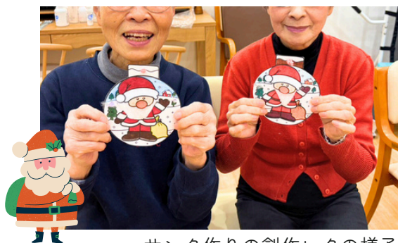
サンタ作りの創作レクの様子