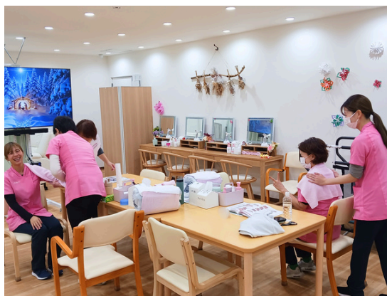
毎月行うスタッフの美容研修の様子

クリスマスにあわせて、ボランティアの方々に来ていただき 音楽鑑賞 を行いました。南米音楽やウクレレの演奏に、最初は静かに耳を傾けていた皆さまも、次第に手拍子をしたり体を揺らしたりと、自然と笑顔が広がっていききました。社交ダンスをされていた方は「音楽を聴くと踊りたくなるのよね！」と話され、皆さまと一緒に楽しそうに踊られていました。演奏後には「 モヤモヤしてたことが、なんかスカッとした！あー、楽しかった！ 」と晴れやかな表情に。ウクレレの演奏では、歌詞カードを見ながら懐かしい曲を一緒に口ずさむ場面もあり、「 こんなに歌うことないから、涙出たよ 」と感動される方もいました。中には「 演奏を聴きに行きたくても、子どもに言えなくて...。今日、来てよかった 」と話してくださる方も。音楽を通して気持ちが動き、心がほどける——そんなひとときを大切に、これからも一人ひとりに寄り添っていきます。