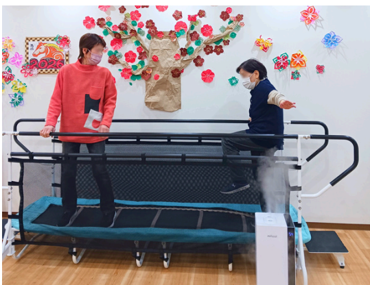
おしゃべりしながら平行棒に取り組む様子