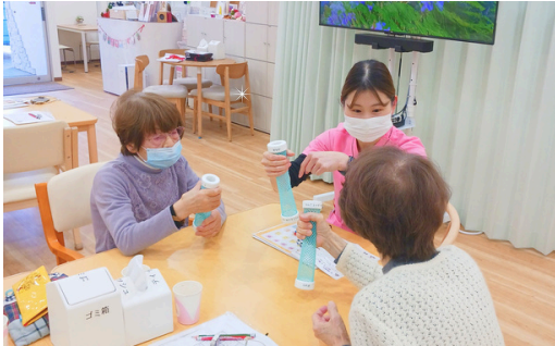
ミニマッサーを使って握力を鍛える様子