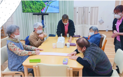
タオルじゃんけんのゲームレクの様子