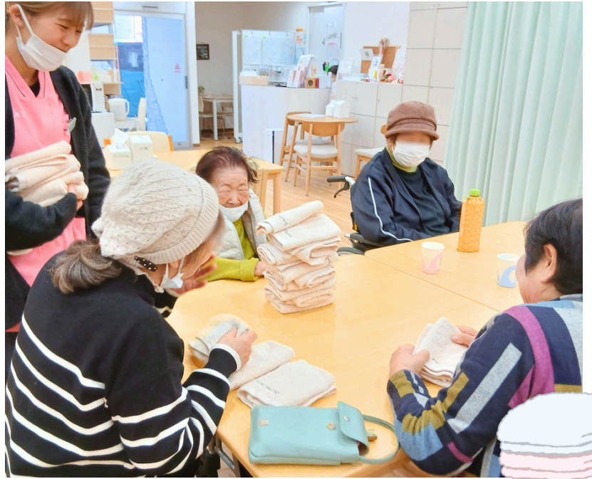
タオル積みゲームレクを楽しむ様子